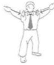
Tsuzukete Hajime Weiterfahren nach Unterbruch