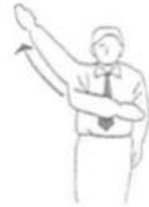
Ippon Ganzer Punkt