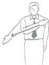
Waza-ari 90% Punkt