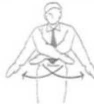
Torimasen Keine Wertung