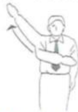
Aka no Kachi Rot (Weiss) hat gewonnen