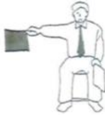
Waza-ari 90% Punkt