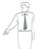
Jogai Kampflinie übertreten