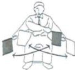
Torimasen Keine Wertung