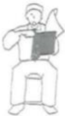
Uke Imasu Blockiert