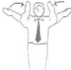
Fukushin Shugo Schiedsrichter herrufen (Alle)