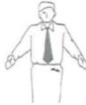
Moto no Ichi Auf die Startlinie