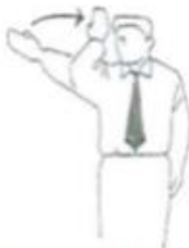
Fukushin Shugo Schiedsrichter herrufen (Einzel)