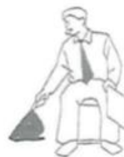
Jogai Kampffläche übertreten